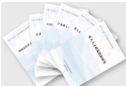
江苏“十三五”人才发展规划专项研究