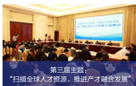
第三届主题： “扫描全球人才资源，推进产才融合发展”