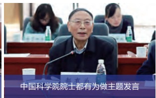
中国科学院院士都有为做主题发言