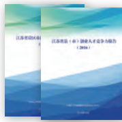
2016江苏区域创业 人才竞争力研究报告

(3) 2017年人才竞争力系列报告：通过7.8万多个基础数据分析江苏人才发展现状。