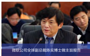
微软公司全球副总裁陈实博士做主旨报告