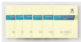
6大领域人才竞争力报告（2015）

(1) 2015年人才竞争力系列报告：通过5.6万多个基础数据分析江苏人才发展现状，其中江苏高校、工业企业及园区人才竞争力等研究首开国内先河。