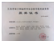
报告获第14届哲学社会科学 优秀成果二等奖