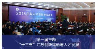
第一届主题： “十三五”江苏创新驱动与人才发展