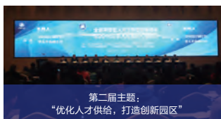
第二届主题： “优化人才供给，打造创新园区”