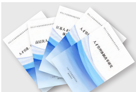
深化人才发展体制机制改革专项研究