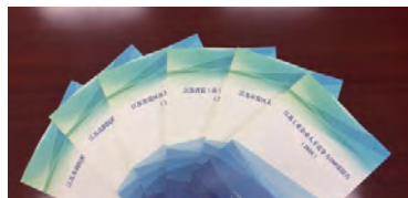
6大领域人才竞争力报告（2016）