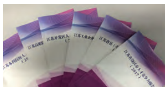
6大领域人才竞争力报告（2017）

(3) 2017年人才竞争力系列报告：通过7.8万多个基础数据分析江苏人才发展现状。