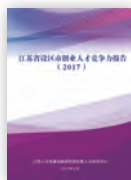
2017江苏设区市创业 人才竞争力研究报告