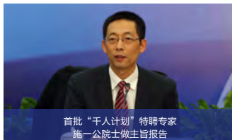
首批“千人计划”特聘专家 施一公院士做主旨报告